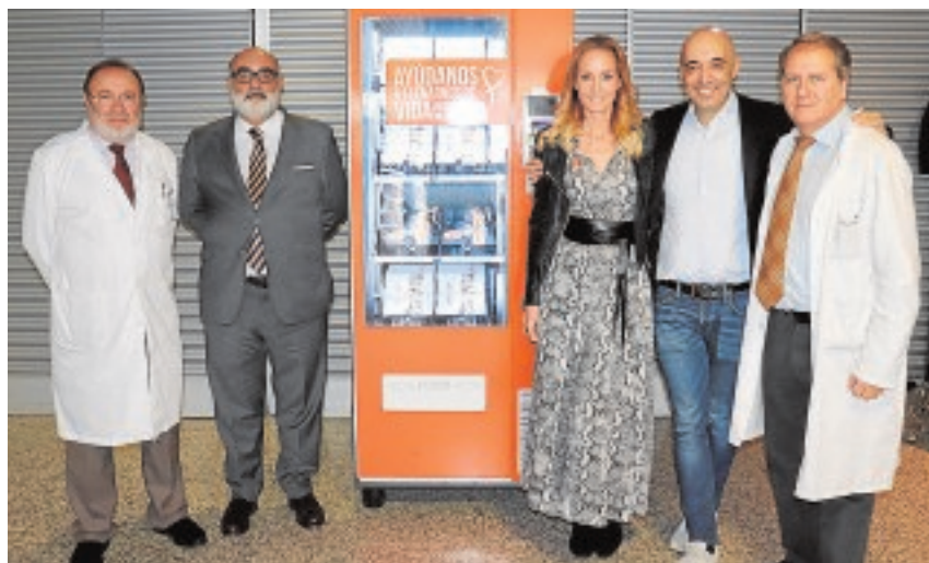
Responsables de la empresa Minsait, junto a los de la Fundación Sandra Ibarra, de la Fundación Cipri Quintas y del Hospital Universitario La Paz junto a la máquina expendedora de la campaña «Libro Solidario»