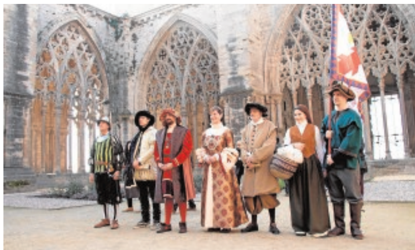
Recreación, en la posada del claustro de la Seu Vella, por parte de Historiadores de Cataluña, del V centenario de la visita del Rey Carlos I de Habsburgo a Lérida