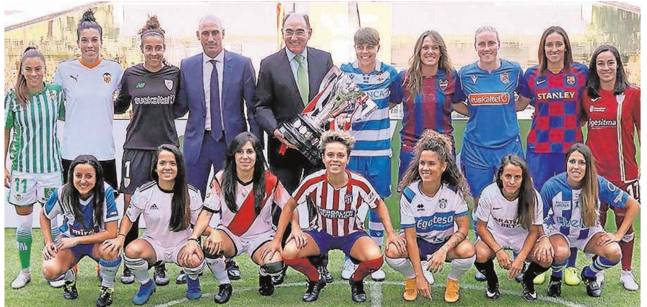
Las jugadoras, junto a Ignacio Galán y Luis Rubiales (izq.), durante la presentación de la Primera Iberdrola

El acto de presentación contó con la participación de jugadoras representantes de todos los clubes que disputarán el torneo, así como del presidente de Iberdrola, Ignacio Galán, y el presidente de la RFEF, Luis Rubiales, entre otras autoridades. Iberdrola llegó a un acuerdo con la RFEF, el pasado 1 de agosto, por el que da nombre a la máxima competición nacional, la Primera Iberdrola, y a la segunda división, denominada Reto Iberdrola. Además, impulsa tanto la Copa de la Reina como la Supercopa de España.